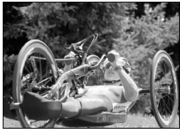
Rien n'a été facile pour Ursula Schwaller.