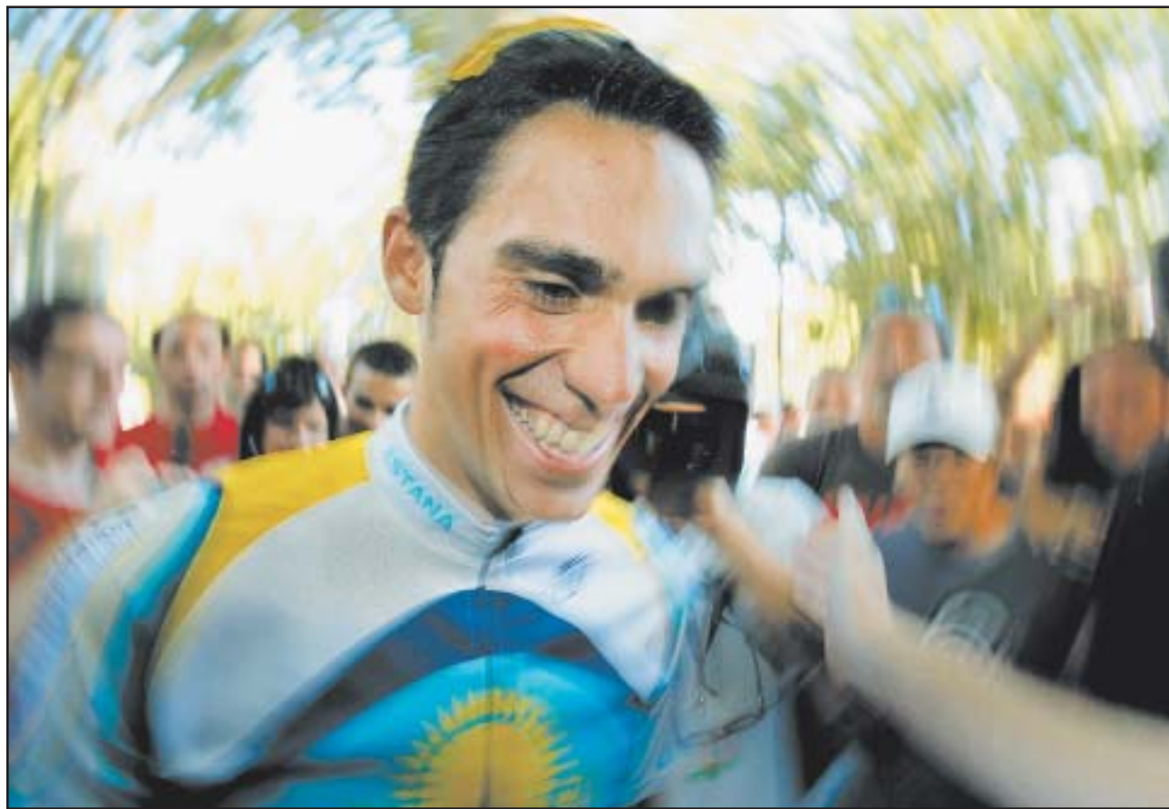
Alberto Contador a le sourire, mais l'arrivée à Madrid c'est dans neuf jours...

Coupé de la tête du peloton qui en a profité pour accélérer, Valverde a payé l'addition cash: il a rétrogradé de la 4 e à la 11 e place, avec plus de