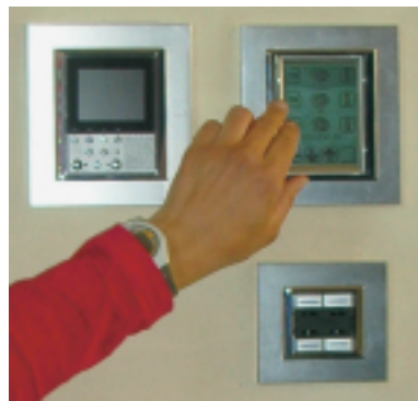
Alle Haustechnik-Funktionen vereint und zentral im Griff