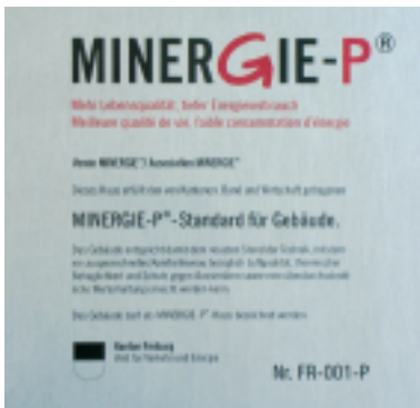
Minergie-P-Standard: Sechsmal weniger Energieverbrauch als bei einem herkömmlichen Einfamilienhaus